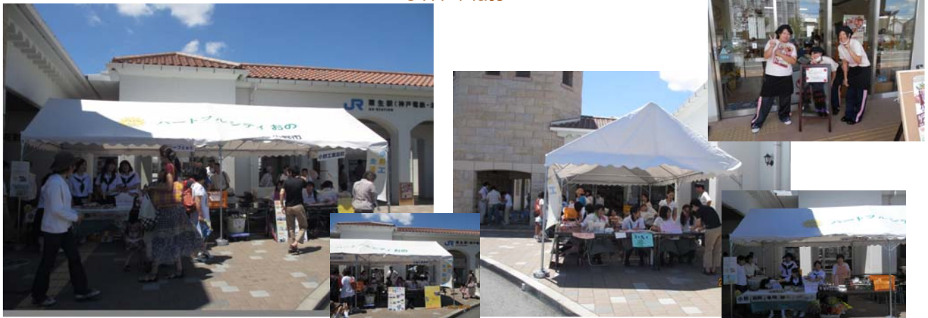
改札前では、テント内で小野高校、グループとまと、小野工業高校による物品販売がありました。