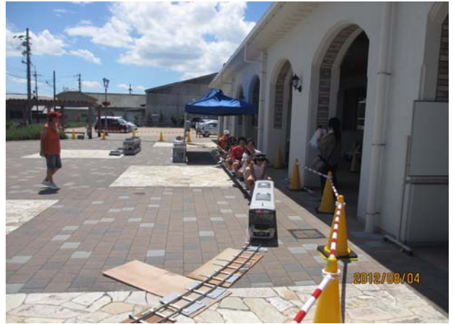
猛暑のため、テントを用意しました。