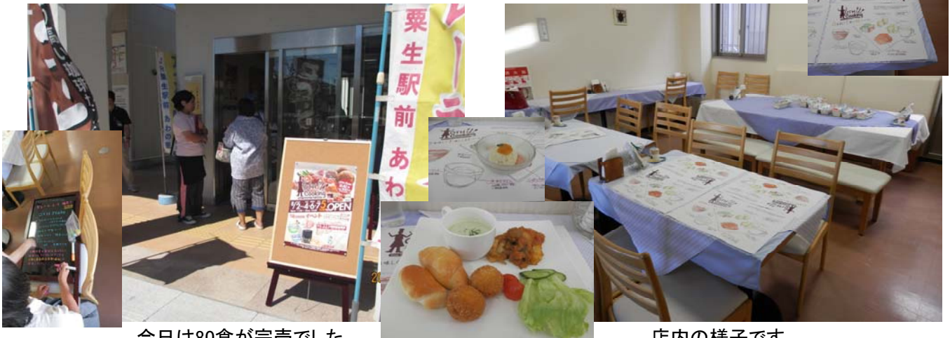
今日は80食が完売でした。

～8月4日、小野工業高校生活創造科の高校生による「レストラン」（OTH Cooking）の開催にあわせ、神戸電鉄の6000系ミニトレインがあお陶遊館東側の広場で運行しました。同時開催されたイベントとあわせて、その様子をお知らせします。～