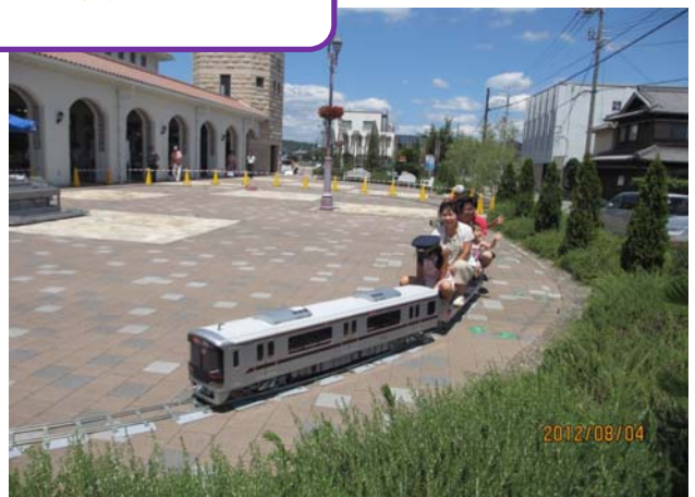
帽子を用意しましたが、好評でした。