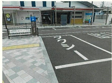
車椅子用駐車区画を青色着色、路面には大きく文字表示し、分かりやすさに配慮