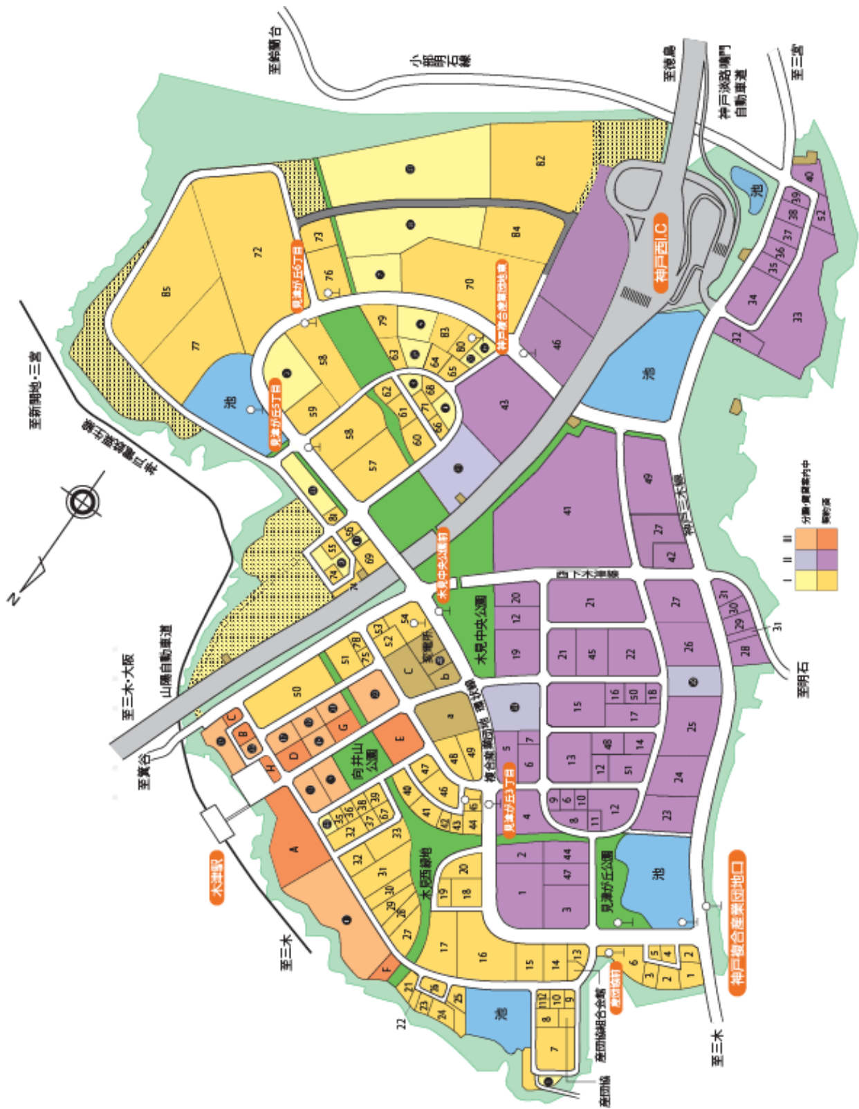
図 団地現況 (H29. 3. 31)