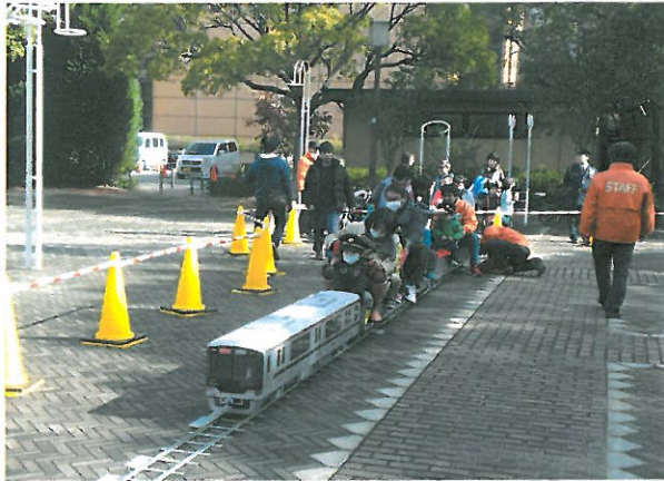
初日は反時計廻りで運行しました