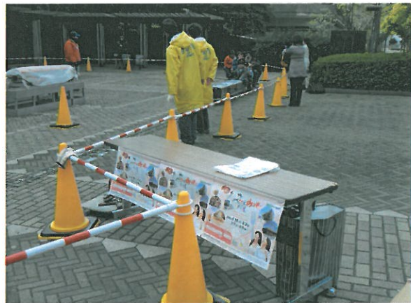
おの恋&みっきいバルのPRをしています