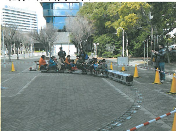
本日は時計廻りでの運行となりました