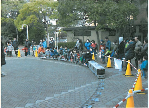
かなりのお客様が並んでいただきました