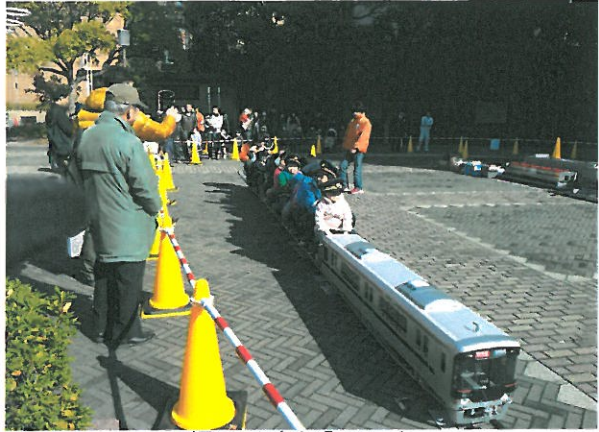
帽子は大好評でした