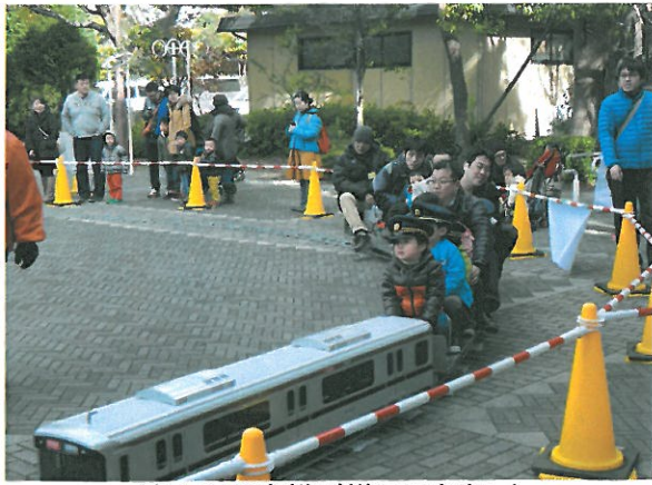
徐々にお客様が増えてきました