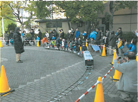
カメラ撮影が大変です