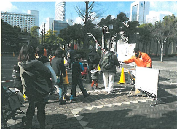
おの恋&みっきいバルのチラシを配布しました