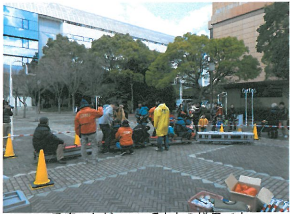
乗車いただいている様子です