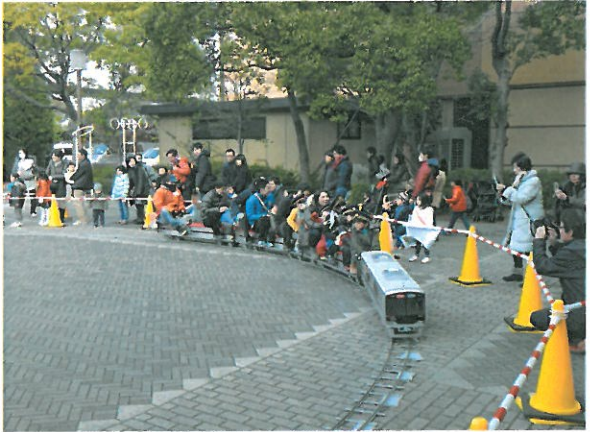
手を振って皆笑顔でした