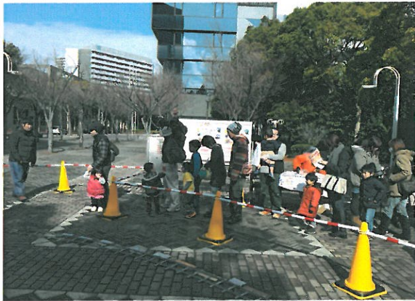
特に小さなお子様喜んで並んでくれました

2月8日も予定されていましたが、あいにくの雨で残念ながら運行は中止となりました。9日は、 715人 の方に乗車いただきました。3月1日から2日の小野陣屋まつり、3月8日から9日の山田錦まつりにあわせて開催されるおの恋&みっきいバルのチラシを中心に配布しました。