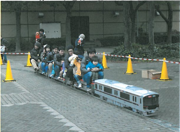
親子連ればかりの運行となりました