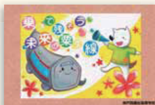
神戸鈴蘭台高校 西鈴蘭台駅