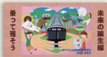
兵庫商業高校 鈴蘭台駅