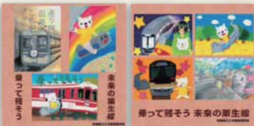
三木東高校 志染駅