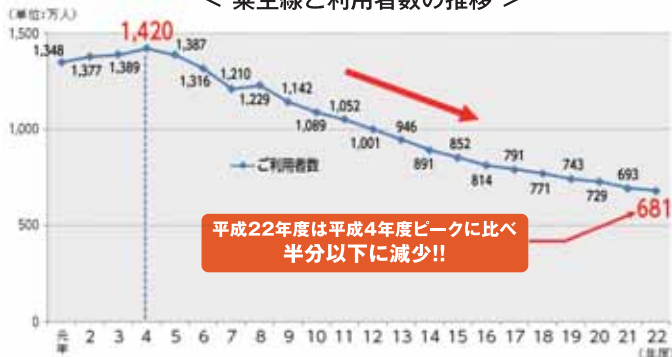
< 粟生線ご利用者数の推移 >