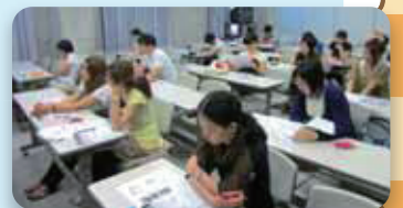
デザイン公募学内説明会の状況

神戸芸術工科大学は平成元年に設立したアート・デザインの総合大学ですが、アートとデザインの教育・研究の他、「神戸ルミナリエ」のポスターデザインや、「播州織り」のファッションデザインへの展開などの特に近年では地域社会の要請に応える種々の実践的デザインを学生らと展開しています。