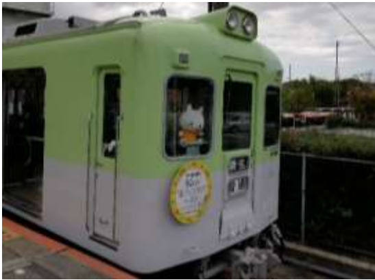
「産フェスおの」ヘッドマーク付きメモリアルトレイン