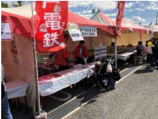
神戸電鉄粟生線活性化協議会特設ブース