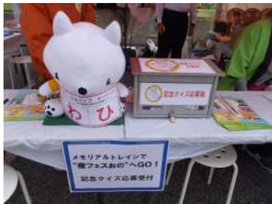
記念クイズの実施