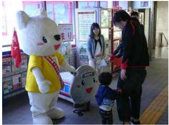
「しんちゃん&てつくん」との記念撮影 (小野駅)