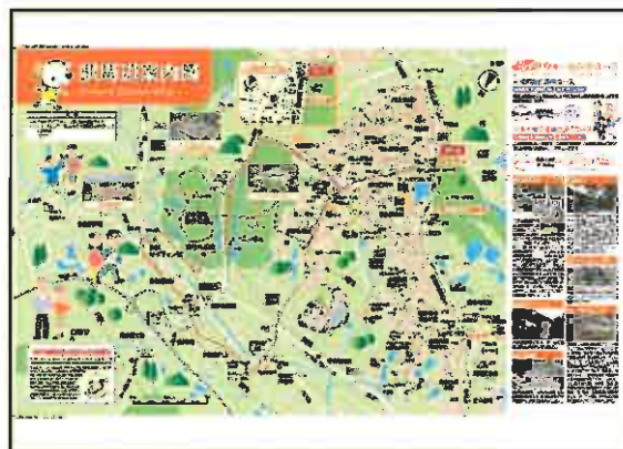
看板面のイメージ

緑が丘駅周辺のアクセス施設（バス・駐車場・駐輪場など）や沿線名所、ハイキングコース、バスルート等を表示した自立式案内看板を設置し、利便性向上による利用促進を図ります。