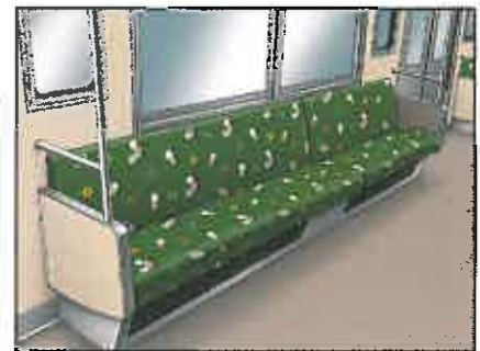
キャラクターシート内装イメージ