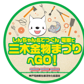
記念ヘッドマーク